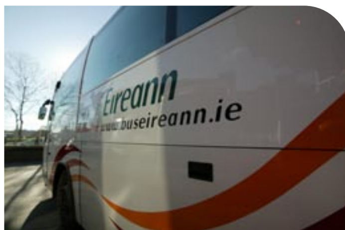
Libhré Feithicle nua

Tugadh isteach 101 seirbhís nua iompair scoile i rith 2004, sa réimse iompair do leanaí le riachtanais speisialta den chuid