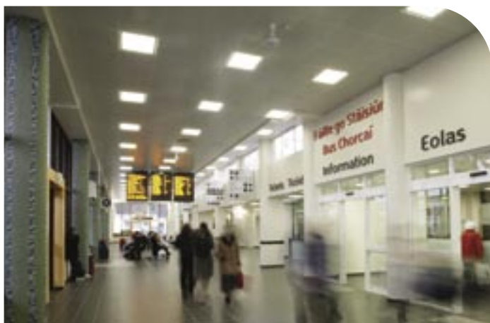
An Taobh Istigh de Stáisiún Bus Chathair Chorcaí, Plás Parnell atá nuachóirithe.

Ó 2000 i leith, tá an líon custaiméirí ar bhealaí achar fada agus comaitéara méadaithe 25%. Ar sheirbhísí cathrach Bhus Éireann, mar thoradh ar mhinicíochtaí níos airde a bheith á dtairiscint agus uasghradú leanúnach na flít, tá méadú de 10% tagtha ar an líon custaiméirí a iompraíodh le cúig bliana anuas.