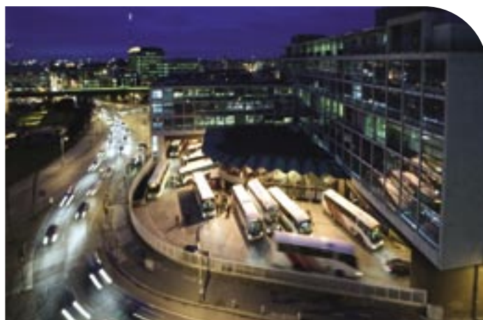
Radharc ón spéir ar Bhusáras, Baile Átha Cliath