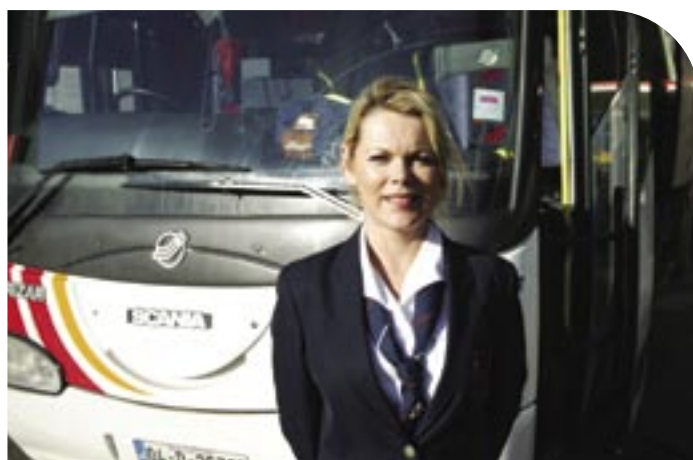
Bus Éireann ag 'Infheistiú i nDaoine'

Is iad cuspóirí formiolána na cuideachta i bhforbairt bhainistíochta ná, a chinntiú a mhéad is féidir é, go mbíonn ar chumas na bainistíochta déileáil le dúshlán i dtimpeallacht athraitheach agus an próiseas do phleanáil comharbachta a fheabhsú.