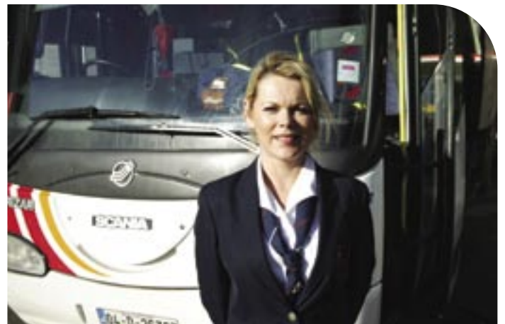
Bus Éireann ag 'Infheistiú i nDaoine'

Is iad cuspóirí formiolána na cuideachta i bhforbairt bhainistíochta ná, a chinntiú a mhéad is féidir é, go mbíonn ar chumas na bainistíochta déileáil le dúshlán i dtimpeallacht athraitheach agus an próiseas do phleanáil comharbachta a fheabhsú.