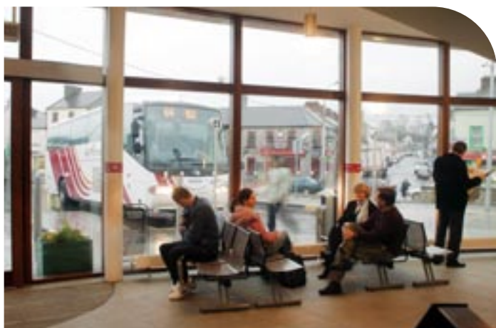
An Taobh Istigh de Stáisiún Bus Shligigh atá nua-athchóirithe.

Léirítear an infheistiú sa líon leanúnach ard custaiméirí i 2004, agus ráta sástachta an-ard custaiméirí, le custaiméirí Bhus Éireann ag tuairisciú ráta sástachtacht 91% tar éis iniúchadh neamhspleách ar na tiomantais a thug Bus Éireann ina Chairt Paisinéirí.