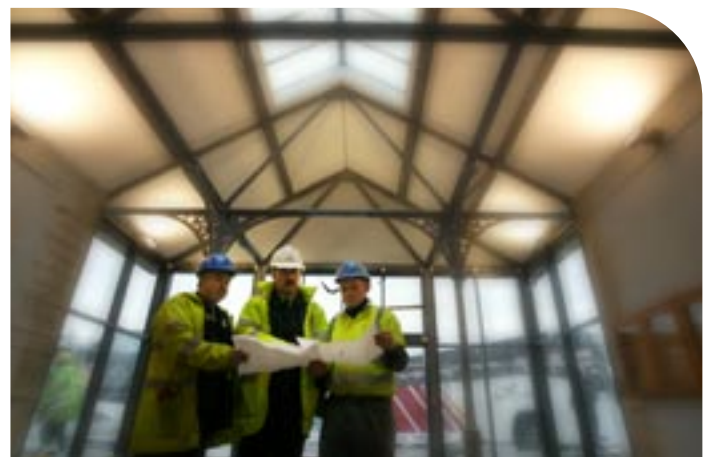
Obair athchóirithe ar cheann dár stáisiúin bus.

Rinneadh obair athchóirithe ar roinnt stáisiúin bus chun rochtain a fheabhsú do chustaiméirí a bhfuil lagú gluaiseachta ag gabháil dóibh le maoiniú ón bPlean Forbartha Náisiúnta. Is iad na stáisiúin a bhain buntáiste as na tionscadail feabhsúcháin inrochtaine ná Baile Átha Cliath (Busáras), Béal an Átha, Leitir Ceanainn agus Corcaigh.