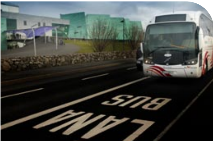
Seirbhís Aistear Fada le I.T. na Gaillimhe-Maigh Eo sa chúla.

Cuireadh seirbhísí comaitéara breise ar fáil in ionaid ar nós an Muileann gCearr, Baile Átha Cliath, Baile Mhistéala, Port Láirge, Trá Mhór, Sligeach, Béal an Átha, Cill Airne, Neidín agus Corcaigh.