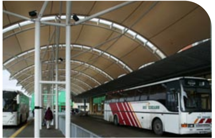
Cumhdach Nua ag Stáisiún Bus Chathair Chorcaí

I 2004, lean Bus Éireann de bheith ag tógáil, ag nuachan agus ag feabhsú a ghréasáin lánpháirtithe seirbhísí a chuirtear ar fáil do chustaiméirí agus tá sin déanta ag rátaí ísle fóirdheontais agus ar leibhéil ísle táillí de réir chaighdeáin na hEorpa.